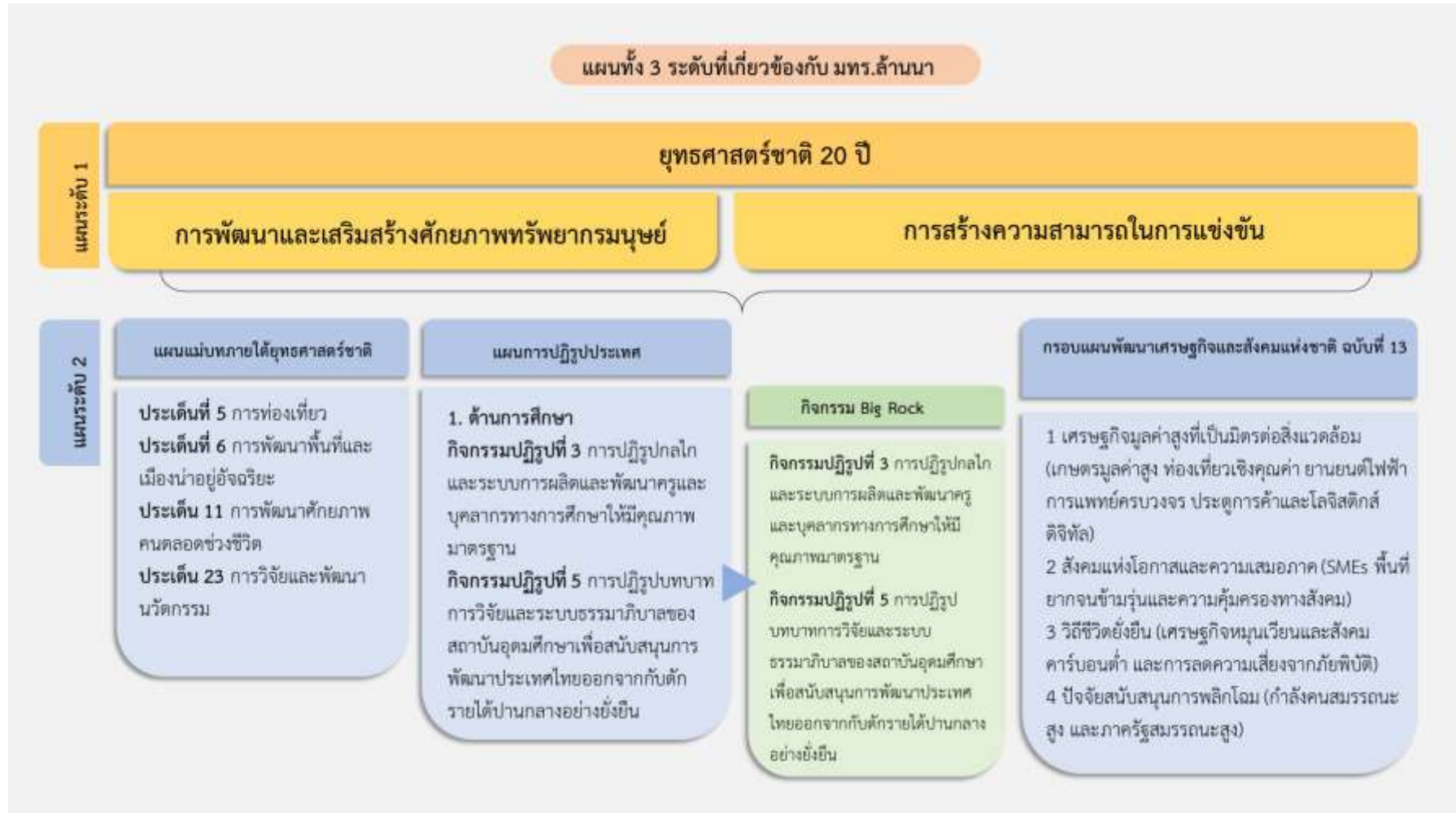
รูปที่ 6 (A) แผน 3 ระดับที่เกี่ยวข้องกับมหาวิทยาลัยเทคโนโลยีราชมงคลล้านนา