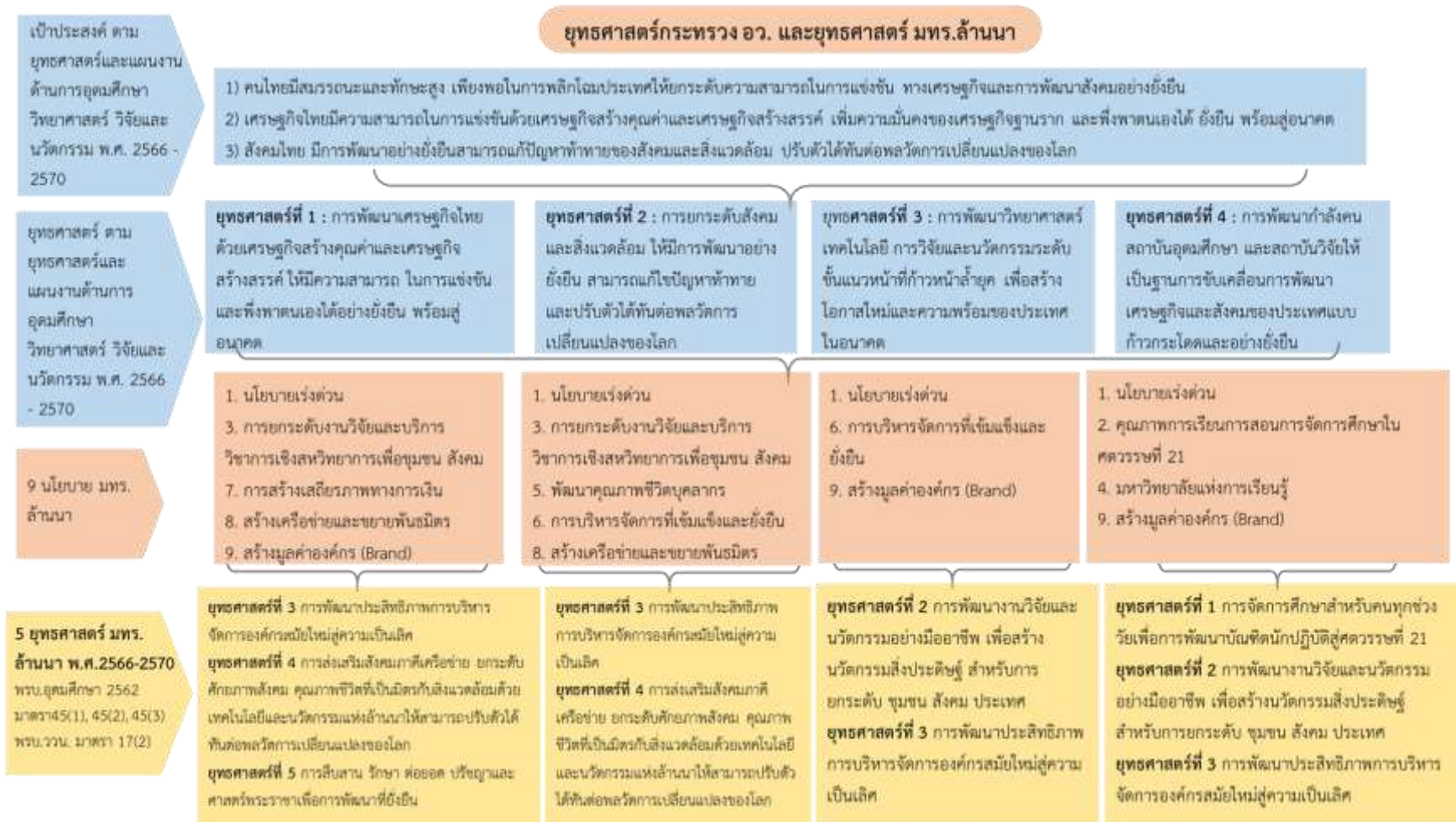
รูปที่ 6 (B) แผน 3 ระดับที่เกี่ยวข้องกับมหาวิทยาลัยเทคโนโลยีราชมงคลล้านนา