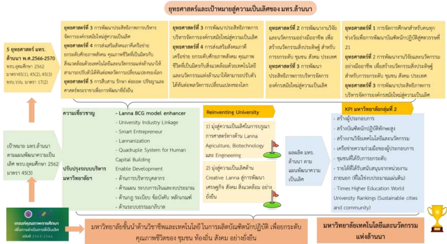
รูปที่ 6 (C) แผน 3 ระดับที่เกี่ยวข้องกับมหาวิทยาลัยเทคโนโลยีราชมงคลล้านนา