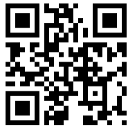
รายงานความก้าวหน้ารอบ ๖ เดือน โครงการ TLO