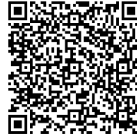
บันทึกความเข้าใจความร่วมมือ โครงการที่ ๒