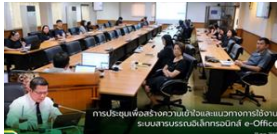
การประชุมเพื่อสร้างความเข้าใจและแนวทางการใช้งานระบบสารสนเทศอิเล็กทรอนิกส์ e-Office 18 พ.ย. 2568