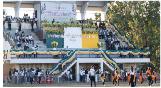
มกร.ล้านนา นำน จัดพิธีบำเพ็ญกุศลปัญญาสมวาร (๕๐ วัน) อุทิศถวายเป็นพระราชกุศลแด่ สมเด็จพระนางเจ้าสิริกิติ์ พระบรมราชินีนาถ พระบรมราชชนนีพันปีหลวง 12 ธ.ค. 2568