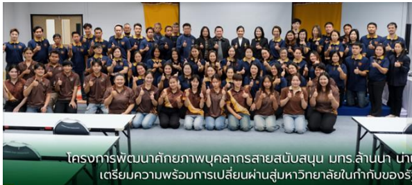
โครงการพัฒนาศักยภาพบุคลากรสายสนับสนุน มกร.ล้านนา นำน เตรียมความพร้อมการเปลี่ยนผ่านสู่มหาวิทยาลัยในกำกับของรัฐ