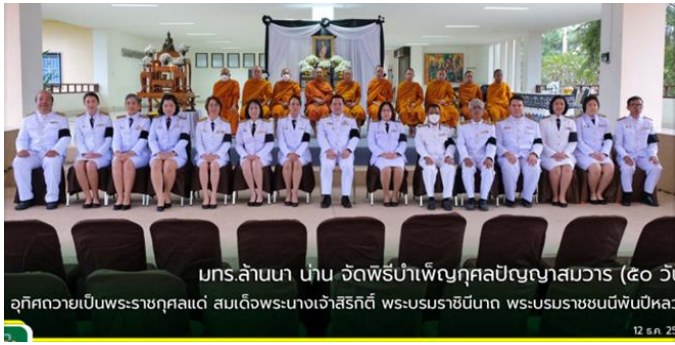
มกร.ล้านนา นำน จัดพิธีบำเพ็ญกุศลปัญญาสมวาร (๕๐ วัน) อุทิศถวายเป็นพระราชกุศลแด่ สมเด็จพระนางเจ้าสิริกิติ์ พระบรมราชินีนาถ พระบรมราชชนนีพันปีหลวง 12 ธ.ค. 2568