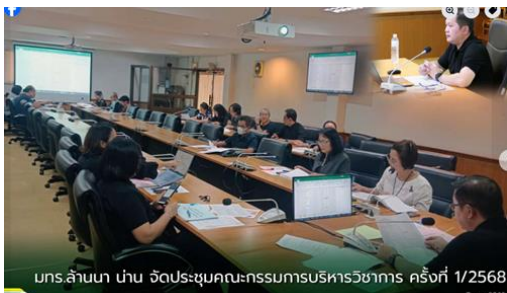
มกร.ล้านนา นำน จัดประชุมคณะกรรมการบริหารวิชาการ ครั้งที่ 1/2568 7 พ.ย. 2568