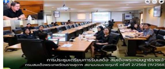
การประชุมเตรียมการรับเสด็จ สมเด็จพระกนิษฐาธิราชเจ้า กรมสมเด็จพระเทพรัตนราชสุดาฯ สยามบรมราชกุมารี ครั้งที่ 2/2568 (11/2568) 11 พ.ย. 2568