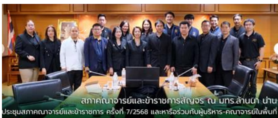
สภาคณาจารย์และข้าราชการสังฆอรุณ มกร.ล้านนา นำน ประชุมสภาคณาจารย์และข้าราชการ ครั้งที่ 7/2568 และหารือร่วมกับผู้บริหาร-คณาจารย์ในพื้นที่