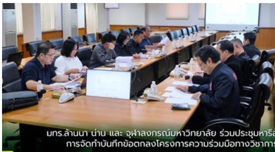
มกร.ล้านนา นำน และ จุฬาลงกรณ์มหาวิทยาลัย ร่วมประชุมหารือการจัดทำบันทึกข้อตกลงโครงการความร่วมมือทางวิชาการ