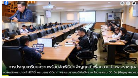
การประชุมเตรียมความพร้อมจัดพิธีบำเพ็ญกุศล เพื่อถวายเป็นพระราชกุศลแด่สมเด็จพระนางเจ้าสิริกิติ์ พระบรมราชินีนาถ พระบรมราชชนนีพันปีหลวง ในวาระครบ 50 วัน (ปัญญาสมวาร) 12 ธ.ค. 2568