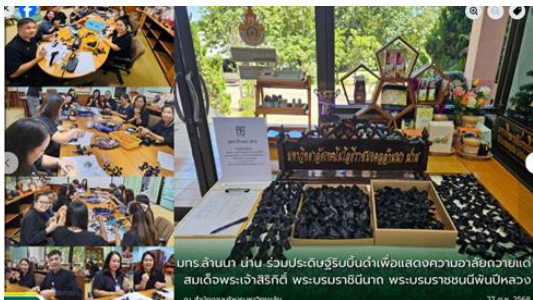
มกร.ล้านนา นำน ร่วมประดิษฐ์ธูปต้นกำเนิดเพื่อแสดงความอาลัยถวายแด่ สมเด็จพระนางเจ้าสิริกิติ์ พระบรมราชินีนาถ พระบรมราชชนนีพันปีหลวง ณ สหวิทยาลัยรัตนธานี 27 ธ.ค. 2568