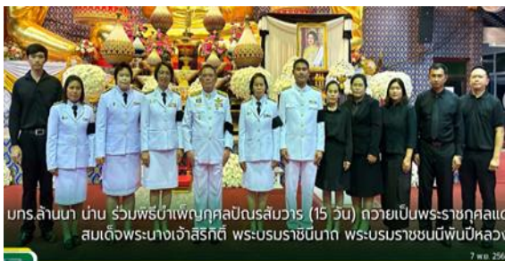
มกร.ล้านนา นำน ร่วมพิธีบำเพ็ญกุศลปณิธาสมวาร (15 วัน) ถวายเป็นพระราชกุศลแด่ สมเด็จพระนางเจ้าสิริกิติ์ พระบรมราชินีนาถ พระบรมราชชนนีพันปีหลวง 7 พ.ย. 2568