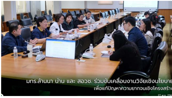
มกร.ล้านนา นำน และ สอวช. ร่วมขับเคลื่อนงานวิจัยเชิงนโยบาย เพื่อแก้ปัญหาความยากจนเชิงโครงสร้าง 27 พ.ย. 2568