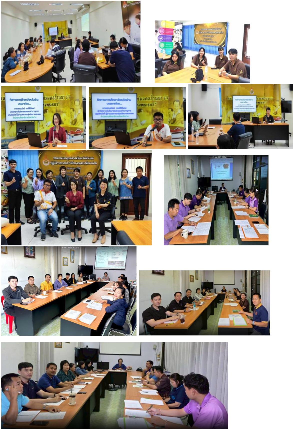
ภาพการประชุมจัดทำแผนของกอง การประชุมหารือการปฏิบัติงาน การติดตามแผนงานโครงการ