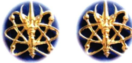
รูปที่ ๑ เครื่องหมายแสดงสังกัด