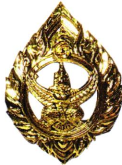
รูปที่ ๓ เครื่องหมายอินทธนู