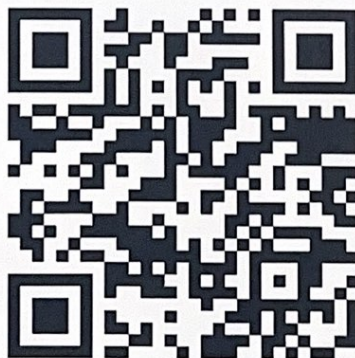
สแกน QR Code เพื่อกำหนดข้อมูลใบสมัครลูกจ้างชั่วคราว

๑๕.๓ ผู้เข้ารับการสอบต้องนำบัตรประจำตัวประชาชนหรือหนังสือเดินทาง หรือหนังสือที่ทางราชการออกให้ที่มีรูปถ่าย และจะต้องแสดงให้กรรมการกำกับห้องสอบตรวจสอบ หากผู้ใดไม่มีบัตรอย่างใดอย่างหนึ่งหรือทั้งสองบัตร กรรมการกำกับห้องสอบจะไม่อนุญาตให้เข้ารับการสอบ