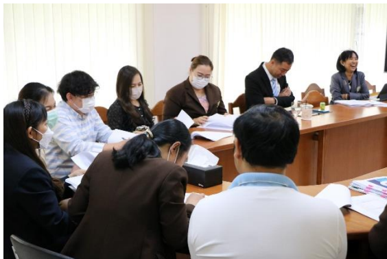
คณะกรรมการฯ ศึกษารายงานการประเมินตนเอง หลักฐานอ้างอิงและสอบถามจากผู้เกี่ยวข้อง