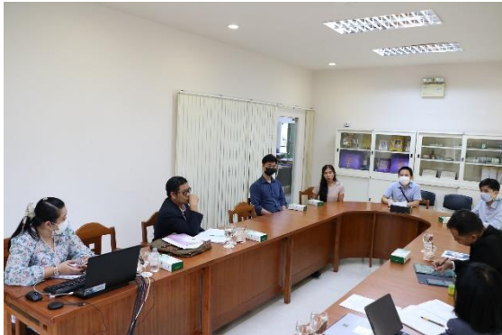
สัมภาษณ์ตัวแทนอาจารย์