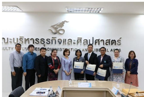
คณะกรรมการประเมินฯ นำเสนอผลการประเมิน