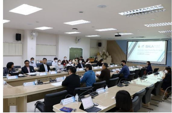
ประธานประเมินฯ ชี้แจงวัตถุประสงค์การประเมินฯ