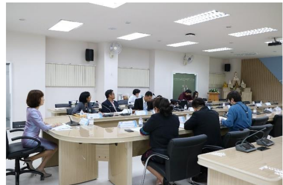
คณะกรรมการประเมินฯ นำเสนอผลการประเมิน