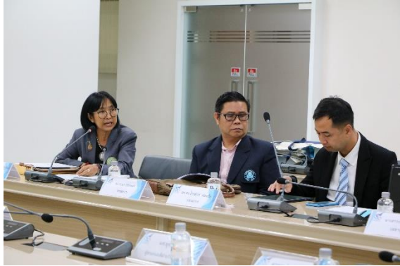
คณะกรรมการฯ ประชุมเตรียมความพร้อม