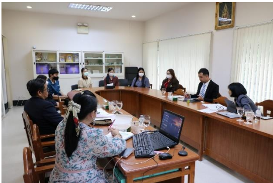
สัมภาษณ์ตัวแทนสายสนับสนุน