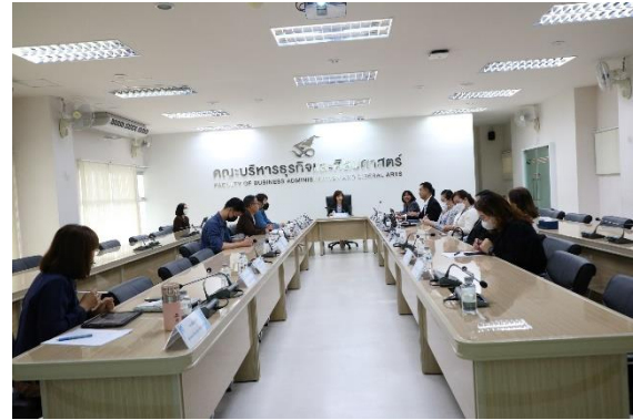
สัมภาษณ์ผู้บริหารคณะ