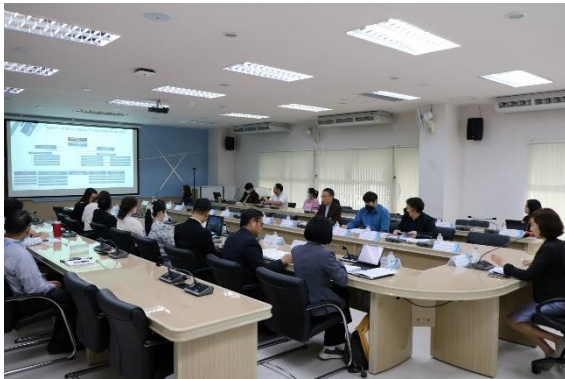
คนบตนำเสนอผลการดำเนินงาน