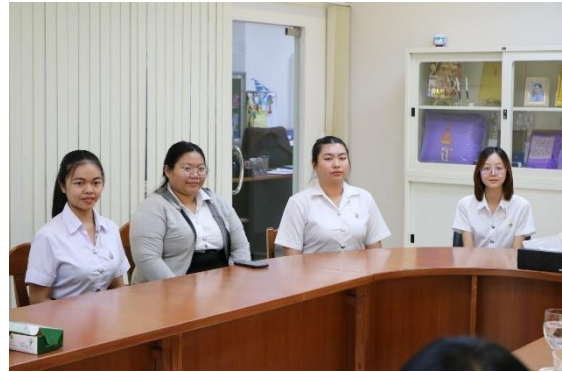
สัมภาษณ์ตัวแทนนักศึกษา