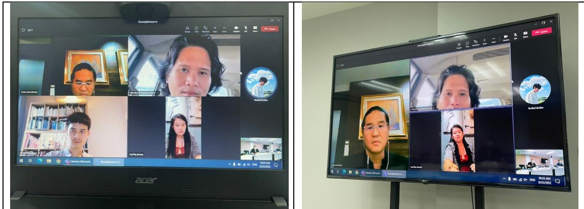
สัมภาษณ์ตัวแทนผู้ประกอบการ/ผู้ใช้บัณฑิต