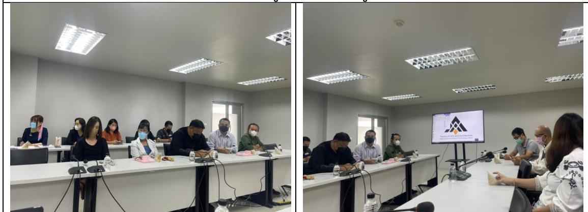
คณะกรรมการสัมภาษณ์ผู้รับผิดชอบและศึกษาเอกสารรายองค์ประกอบ