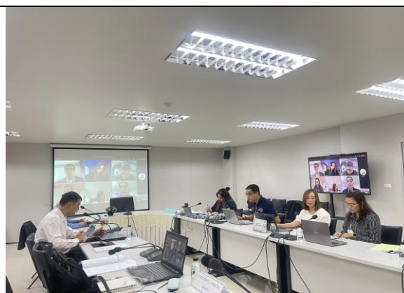
สัมภาษณ์อาจารย์ผู้รับผิดชอบหลักสูตร ผ่านระบบ Microsoft TEAMS