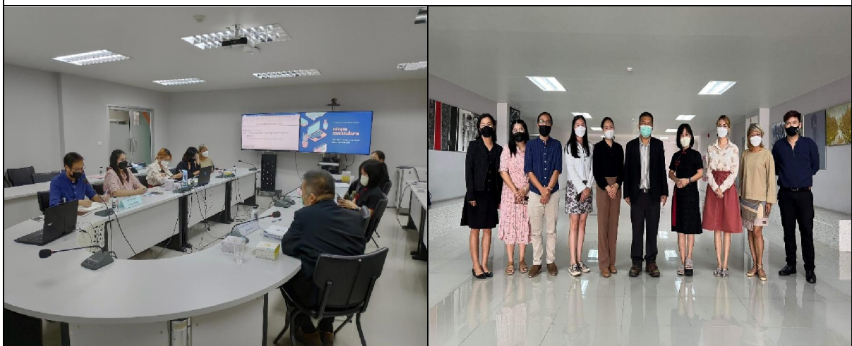
คณะกรรมการสรุปผลการประเมินภายในระดับหลักสูตรด้วยวาจา และถ่ายภาพร่วมกัน