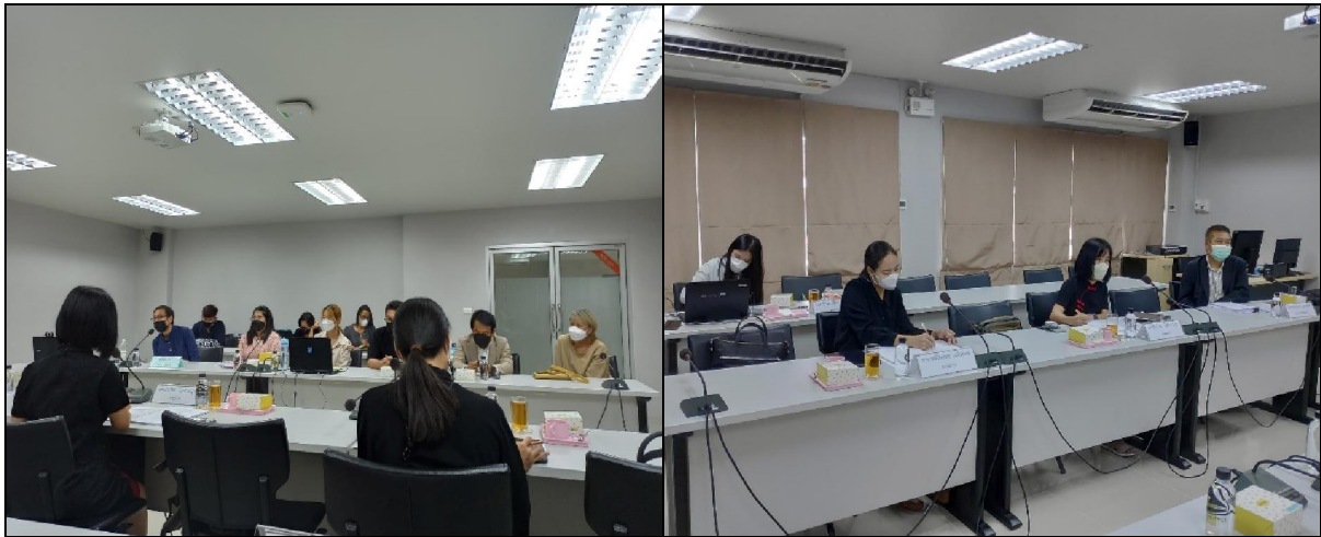
อาจารย์ผู้รับผิดชอบหลักสูตรรายงานผลการดำเนินงานของหลักสูตร