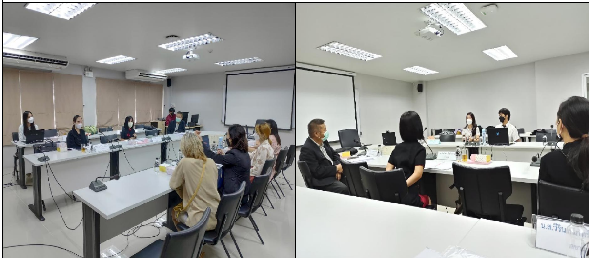
คณะกรรมการสัมภาษณ์อาจารย์ผู้รับผิดชอบหลักสูตร และนักศึกษา