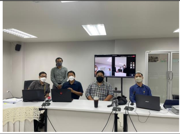
สัมภาษณ์อาจารย์ผู้รับผิดชอบหลักสูตร ผ่านระบบ Microsoft TEAMS