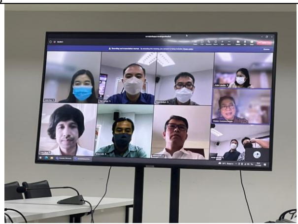
สัมภาษณ์อาจารย์ผู้รับผิดชอบหลักสูตร ผ่านระบบ Microsoft TEAMS