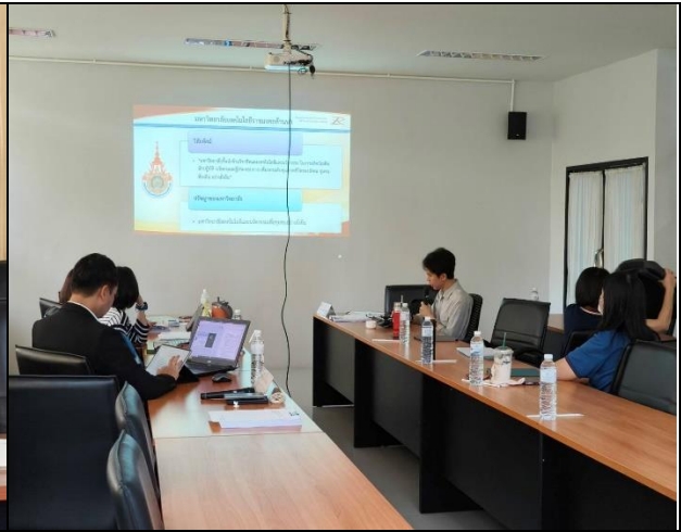
หลักสูตรนำเสนอผลการดำเนินการ