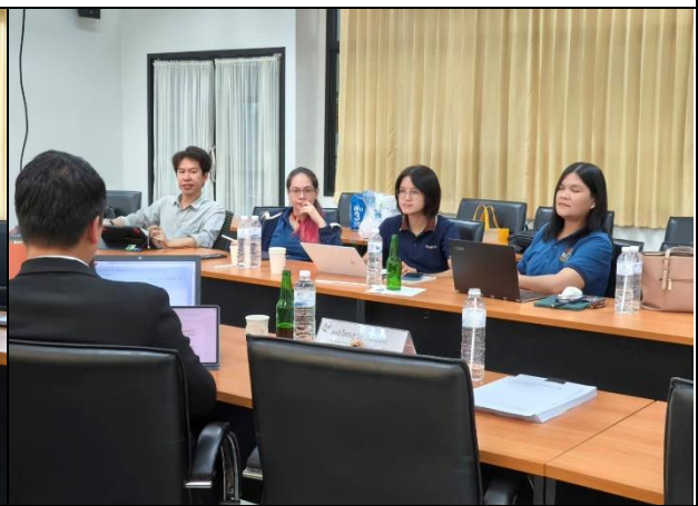
คณะกรรมการประเมินผลการดำเนินการ