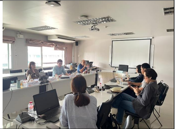
สัมภาษณ์ผู้รับผิดชอบหลักสูตร