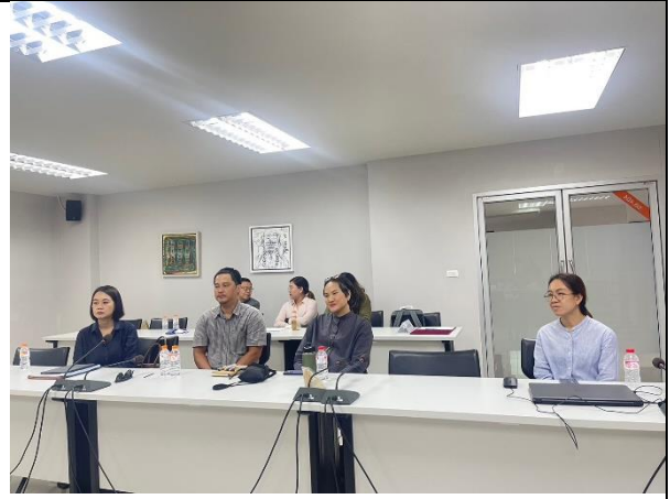
หลักสูตรนำเสนอผลการดำเนินงาน