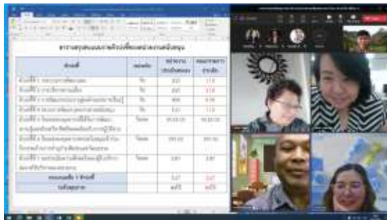
สัมภาษณ์บุคลากร ผ่านระบบ Microsoft TEAMS