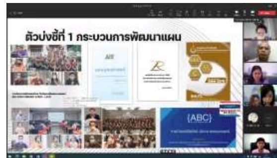
ตัวแทนหน่วยงานนำเสนอผลการดำเนินงาน ผ่านระบบ Microsoft TEAMS