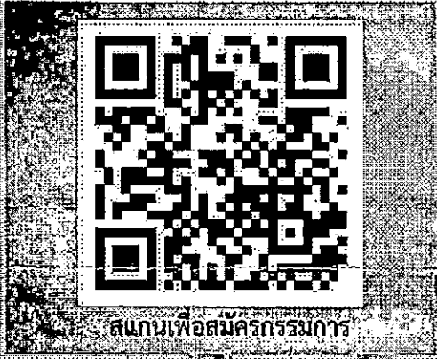
สแกนเพื่อสมัครกรรมการ

ระบบรับสมัครกรรมการตัดสินการแข่งขัน งานศิลปหัตถกรรมนักเรียน ระดับชาติ ครั้งที่ 71 ปีการศึกษา 2566 ภาคเหนือ จังหวัดตาก สำนักงานเขตพื้นที่การศึกษามัธยมศึกษาตาก