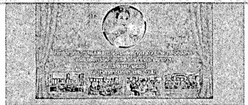
วิดีโอแนะนำ : พิธีเจริญพระพุทธมนต์และเจริญจิตตภาวนาถวายพระพรชัยมงคล แด่สมเด็จพระ... >> ดูเพิ่มเติม

หน้าแรก | เกี่ยวกับหน่วยงาน | บทความ | ปฏิทินการปฏิบัติงาน