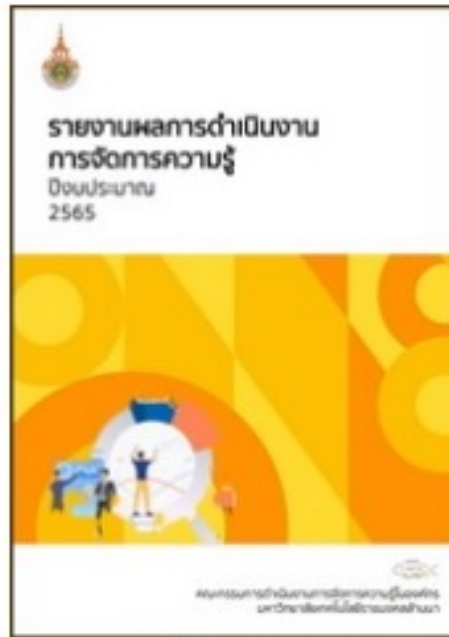
รายงานผลการดำเนินงาน การจัดการความรู้ มทร.ล้านนา ปีงบประมาณ 2565