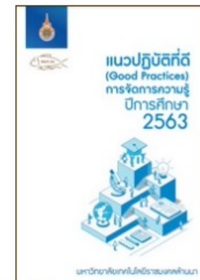
แนวปฏิบัติที่ดี (Good Practices) การจัดการ ความรู้ มทร.ล้านนา ประจำปีการศึกษา 2563