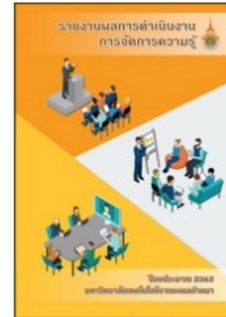
รายงานผลการดำเนินงาน การจัดการความรู้ มทร.ล้านนา ปีงบประมาณ 2563