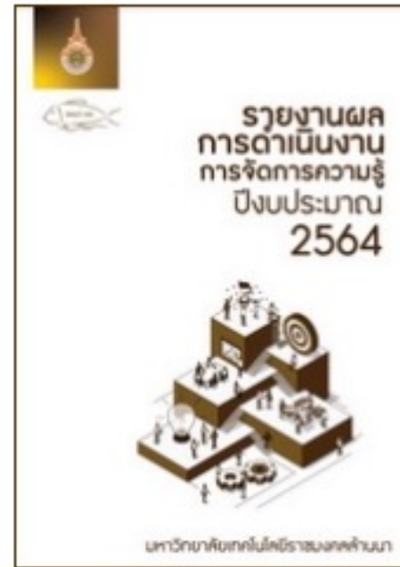
รายงานผลการดำเนินงาน การจัดการความรู้ มทร.ล้านนา ปีงบประมาณ 2564