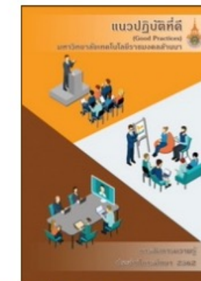
แนวปฏิบัติที่ดี (Good Practices) การจัดการ ความรู้ มทร.ล้านนา ปีการศึกษา 2562