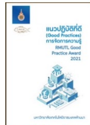
บทความแนวปฏิบัติที่ดี จาก โครงการประกวด แนวปฏิบัติที่ดี มหาวิทยาลัยเทคโนโลยีราชมงคลล้านนา ประจำปี 2564