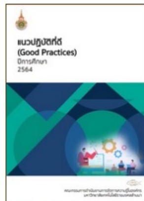
แนวปฏิบัติที่ดี การจัดการความรู้ มหาวิทยาลัย เทคโนโลยีราชมงคลล้านนา ประจำปีการศึกษา 2564