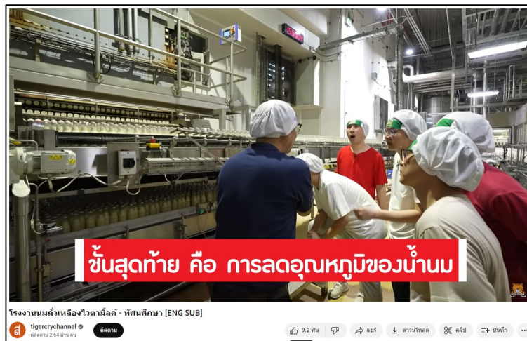
โรงงานผลิตน้ำถั่วเหลือง