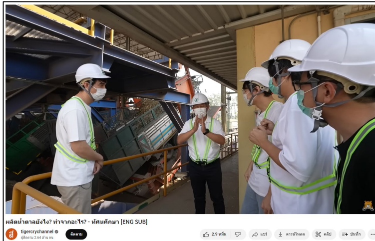
โรงงานผลิตน้ำตาลทราย