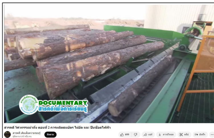
การผลิตบัตร์ ไม้อัด และ ปืนซ็อตไฟฟ้า