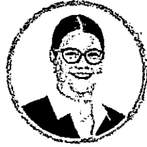
คุณนำฝน บุญยะวัฒน์ รองผู้อำนวยการด้านนโยบายและแผน การท่องเที่ยวแห่งประเทศไทย