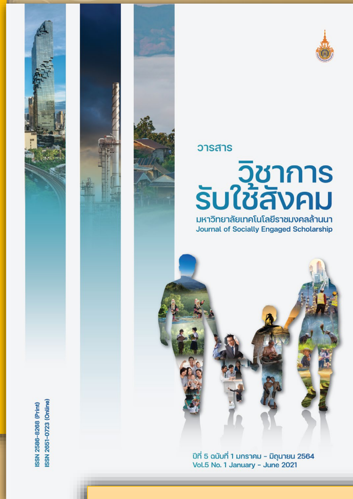
วารสารวิชาการรับใช้สังคม ปีที่ 5 ฉบับที่ 1

https://kaewpanya.rmutl.ac.th/cttc/jses/store.php