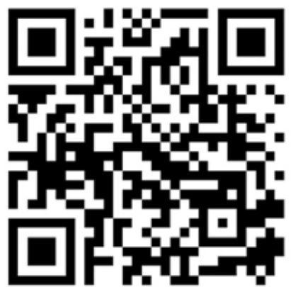
QR Code เล่มคู่มือ

วารสารวิชาการ รับใช้สังคม มหาวิทยาลัยเทคโนโลยีราชมงคลล้านนา RMUTL Journal of Socially Engaged Scholarship ISSN 2586-8268 University of Technology Lamna