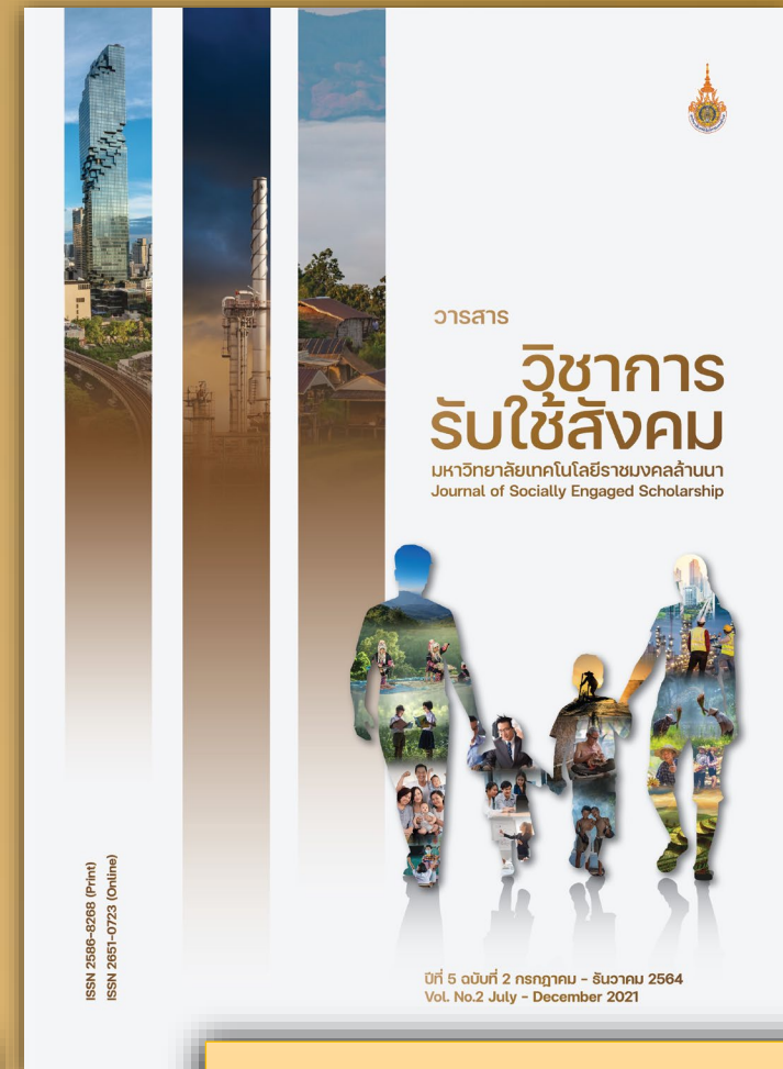
วารสารวิชาการรับใช้สังคม ปีที่ 5 ฉบับที่ 2