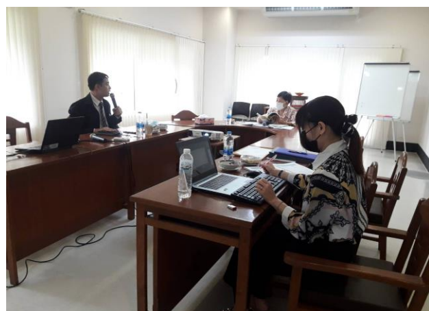
คณะกรรมการประเมินฯ ประชุมสรุปผลการประเมิน