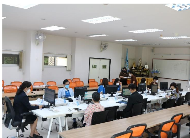
คณบดีฯ รายงานสรุปผลการดำเนินงานของคณะ ในรอบปีการศึกษา 2563