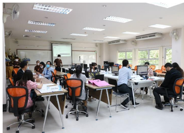
คณะกรรมการฯ ศึกษารายงานการประเมินตนเอง หลักฐานอ้างอิงและสอบถามจากผู้เกี่ยวข้อง