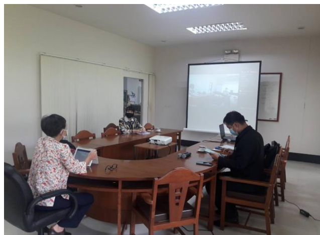
คณะกรรมการประเมินฯ เตรียมความพร้อมร่วมกัน