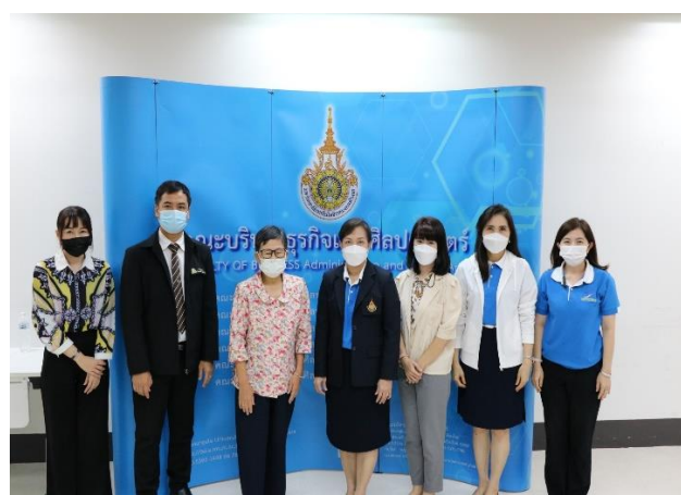
คณะกรรมการประเมินฯ นำเสนอผลการประเมิน