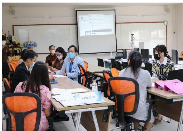
คณะกรรมการฯ ศึกษารายงานการประเมินตนเอง หลักฐานอ้างอิงและสอบถามจากผู้เกี่ยวข้อง