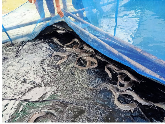
ตำบลบ้านเอื้อม อำเภอเมือง จังหวัดลำปาง