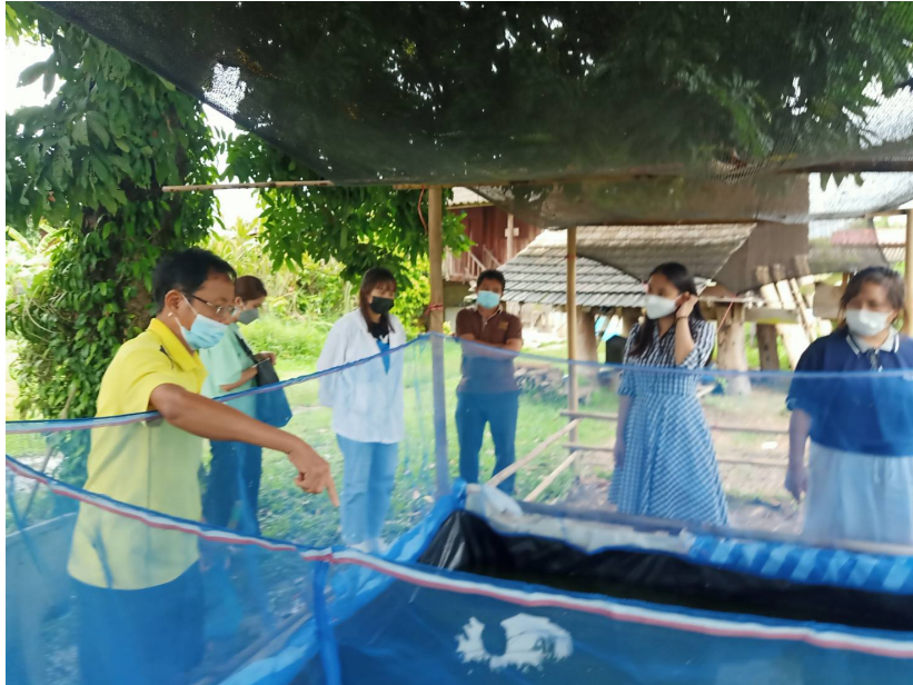
ตำบลบ้านเสด็จ อำเภอเมือง จังหวัดลำปาง