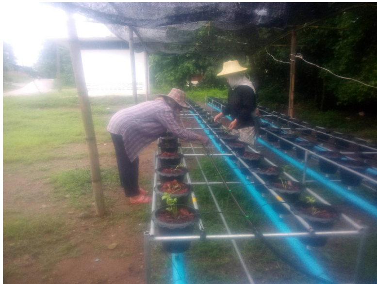
ตำบลพิชัย อำเภอเมือง จังหวัดลำปาง