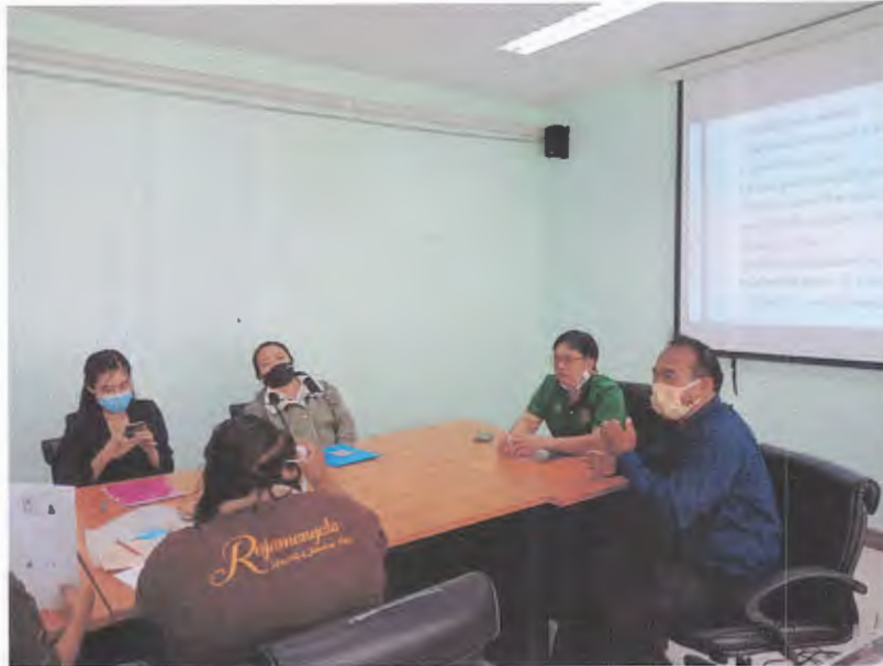
ผู้ช่วยอธิการบดี พิษณุโลก ตรวจสอบและให้กำลังใจ ทีมงานโครงการฯ