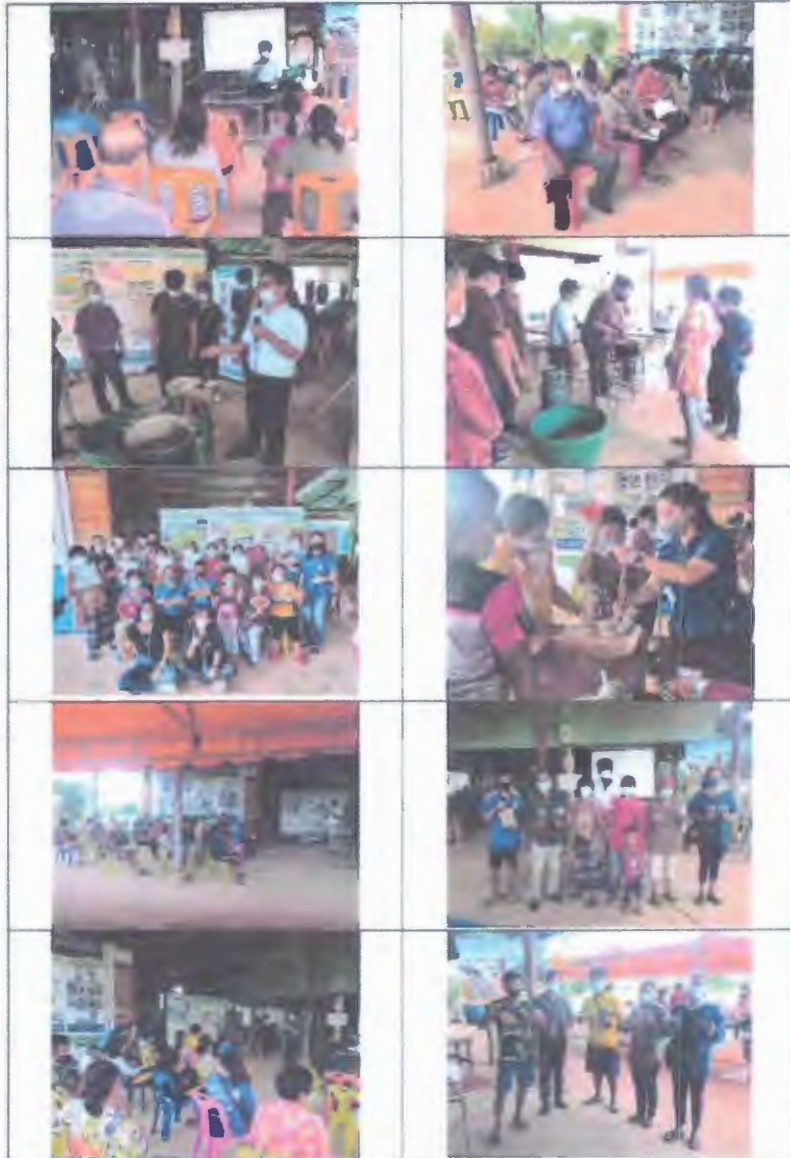
แบบรายงานโครงการ/กิจกรรม (๑.9.1)