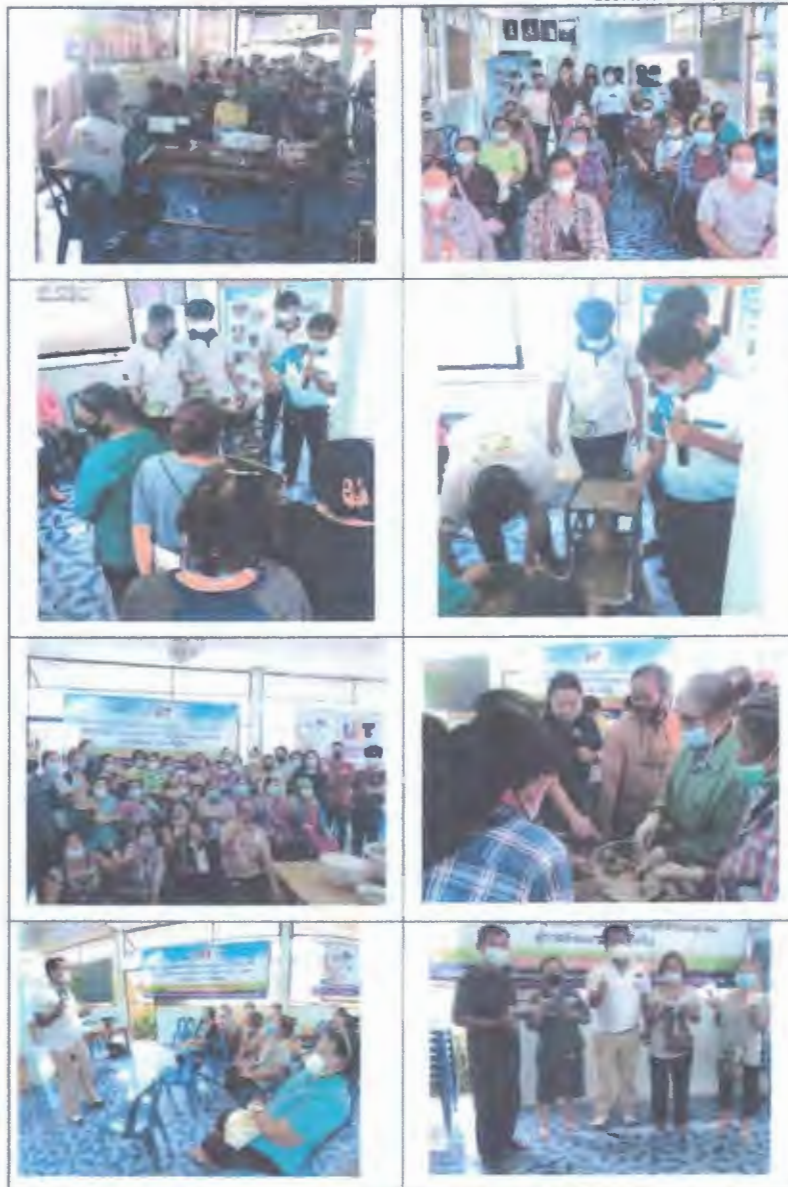
แบบรายงานโครงการ/กิจกรรม (๔.9.1)