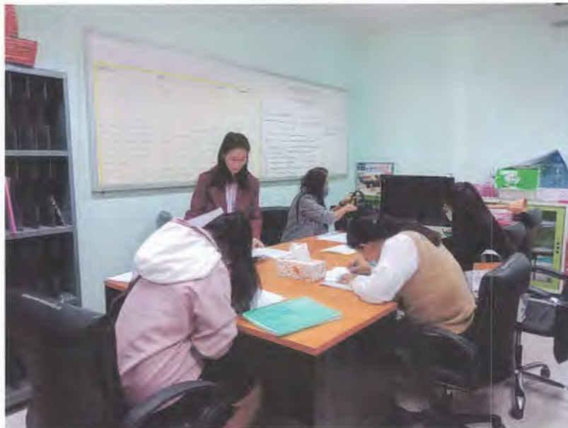
การประชุมทีมงานโครงการฯ