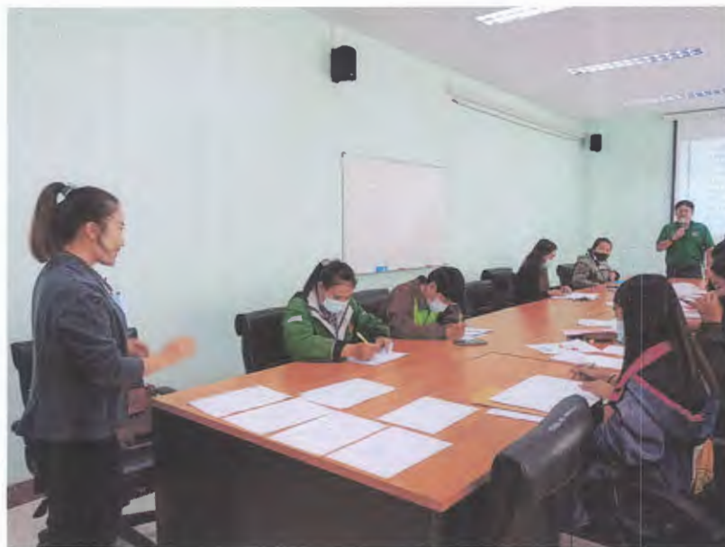
ผู้อำนวยการกองบริหารทรัพยากร ตรวจสอบและให้กำลังใจ ทีมงานโครงการฯ