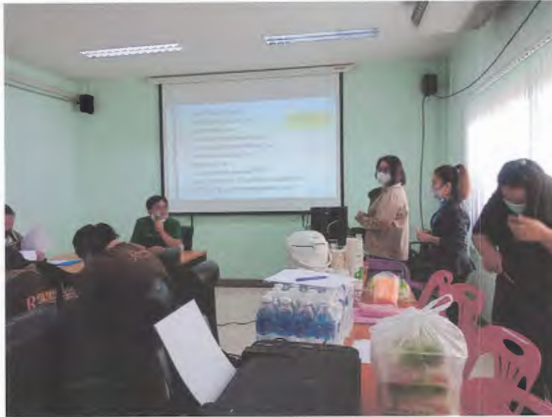
ผู้อำนวยการกองการศึกษา ตรวจสอบและให้กำลังใจ ทีมงานโครงการฯ