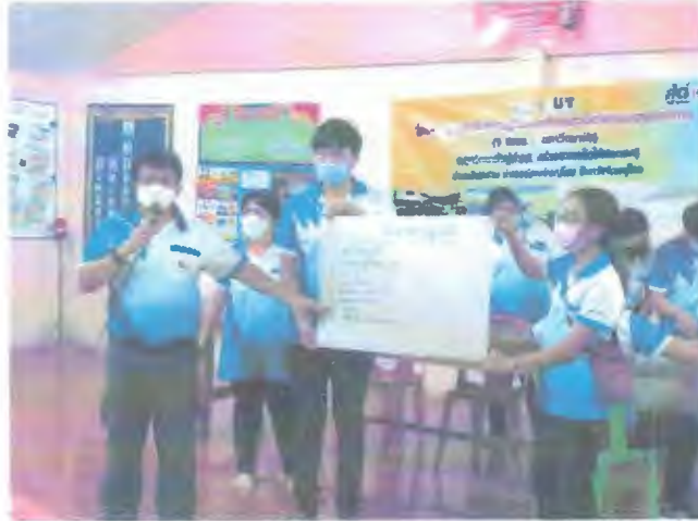
แบบรายงานโครงการ/กิจกรรม (๔.9.1)