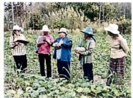
△ การประชุมหารือแนวทางการขึ้นทะเบียนชุมชนและการจดทะเบียนพันธุ์พืชพื้นเมืองเฉพาะถิ่นของฟักทองพันธุ์ไข่เน่า ตามพระราชบัญญัติคุ้มครองพันธุ์พืช พ.ศ. 2542 และกองทุนคุ้มครองพันธุ์พืช เมื่อวันที่ 15 มีนาคม 2564 ณ องค์การบริหารส่วนตำบลบัวใหญ่ และแปลงคัดเลือกสายพันธุ์ฟักทองไข่เน่า นาน อ. นานน้อย จ. น่าน