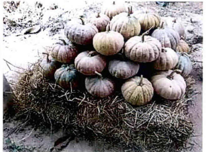
▲ ลักษณะภายนอกของฟักทองไข่เน่า