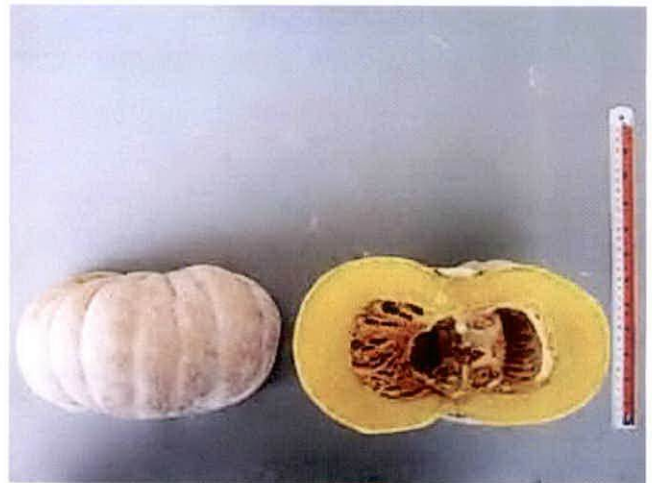
▲ ผักทองไข่เน่า (สายพันธุ์ CM0420-1-1)