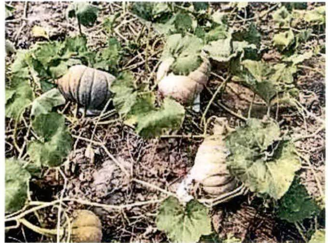
△ การคัดเลือกชี้ที่ 2 จำนวน 12 สายพันธุ์ ณ แปลงของคุณหทัยภัทร ศรีทอง ระหว่างเดือนพฤศจิกายน 2563 - เมษายน 2564