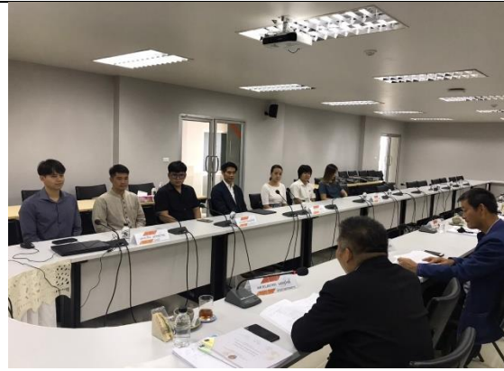
สัมภาษณ์ตัวแทนอาจารย์