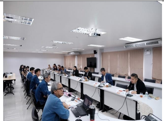
สัมภาษณ์ผู้บริหารคณะ