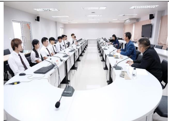
สัมภาษณ์ตัวแทนนักศึกษา