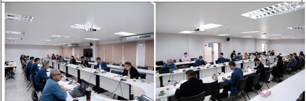
คณะกรรมการประชุมสรุปผลการประเมินฯ ด้วยวาจา