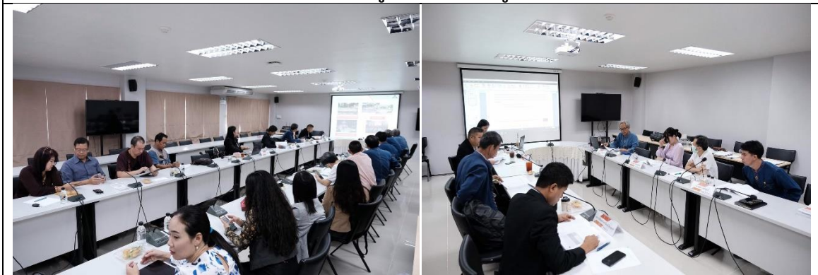
คณะกรรมการศึกษาเอกสารหลักฐาน รายองค์ประกอบ