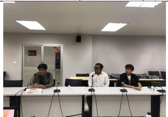
สัมภาษณ์ตัวแทนศิษย์เก่า