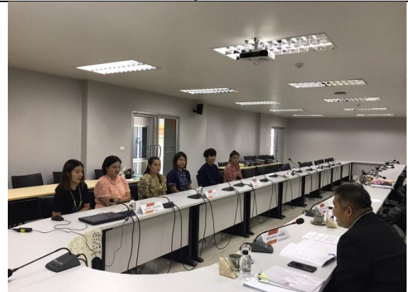
สัมภาษณ์ตัวแทนบุคลากรสายสนับสนุน