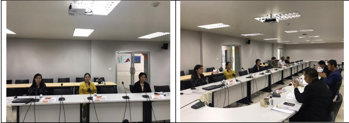
สัมภาษณ์ตัวแทนผู้ประกอบการ/ผู้ใช้งานจิต