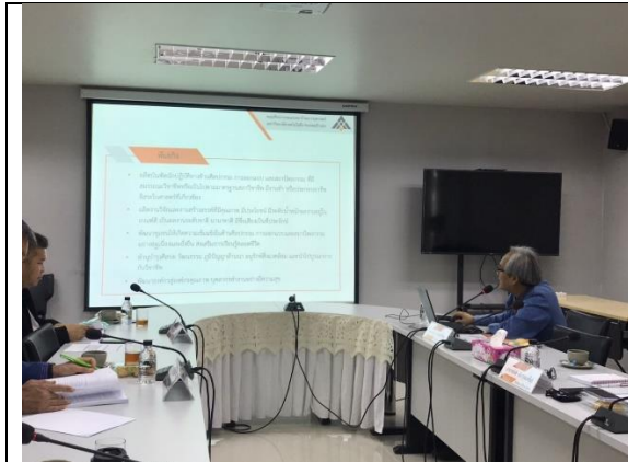
คณิตนำเสนอผลการดำเนินงาน