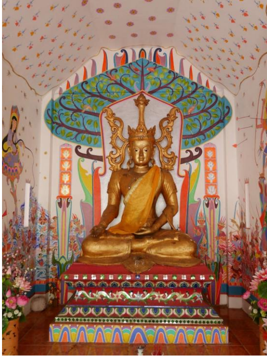
ภาพพุทธประวัติ ตอนตรัสรู้

ในวันเพ็ญเดือน ๖ ปีมะเส็ง ก่อนพุทธศักราช ๑ ปี ในช่วงเช้าพระพุทธรองค์ทรงรับบิณฑบาตที่บ้านนายจุนทะ ซึ่งถือว่าเป็นปัจฉิมบิณฑบาต เมื่อเสร็จจกัตรกิจแล้ว พระองค์ก็เสด็จไปยังเมืองกุสินารา แขวงมัลลละ ทั้งที่กำลังประชวร ไปถึงที่นั่นในตอนเย็น ขณะที่บรรดากษัตริย์มัลลละประชุมกันอยู่ พระอานนท์จึงนำข่าวไปบอกว่าพระพุทธเจ้าเสด็จมา และจะเสด็จนิพพานที่สวนหลวง เหล่าบรรดากษัตริย์ต่างตกตะลึงและตระเตรียมถวายความสะดวกทั้งคณะแพทย์ให้การพยาบาลด้วย ตลอดคืนนั้นพระองค์ทรงโปรดให้ประชาชนได้เข้าเฝ้าเป็นครั้งสุดท้ายและ