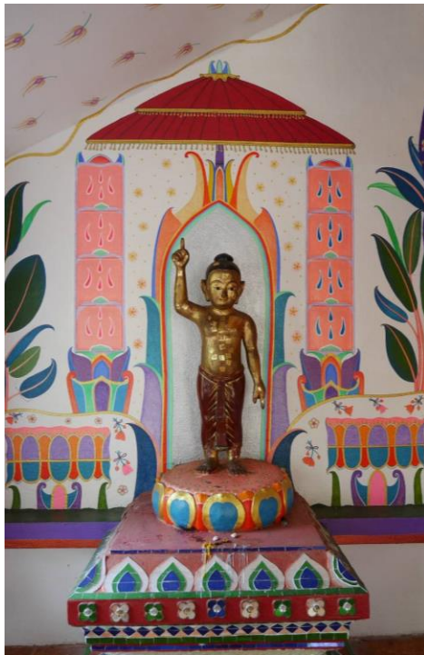
ภาพพุทธประวัติตอนประสูติ

ออกจากเมืองกบิลพัสดุ์ มุ่งหน้าไปยังเมืองเทวทหะ เมื่อกระบวนมาถึง สวนลุมพินี อันเป็นรอยต่อระหว่างเมืองทั้งสอง พระนางสิริมหามายา ก็ ประจวบพระครรภ์ และพระนางก็ได้ประสูติพระโอรส มีรูปร่างลักษณะ สมส่วนตามฐานานุกรมแห่งผู้มีบุญสมพารเพียบพร้อมทุกประการ ทรง พระนามว่าเจ้าชายสิทธัตถะ