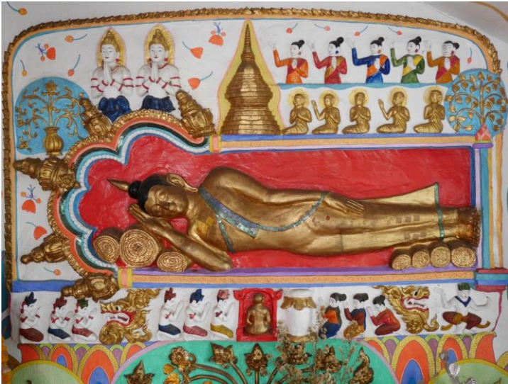
ภาพพุทธประวัติ ตอนดับขันธปรินิพพาน

เตรียมการเรื่องพระสรีรศพในวันรุ่งขึ้น ส่วนพระพุทธเจ้าก็ได้แสดง ธรรมมิได้ขาด ในครั้งนั้นทรงแสดงธรรมแก่สุภัททปริพพาชก ให้บวชใน พระธรรมวินัย และได้บรรลุมรรคผล ถือเป็นปัจฉิมสักขีสาวกองค์สุดท้าย และได้ตรัสธรรมบรรยายเป็นปัจฉิมวาจาว่า “...หนุตทานิ ภิกขเว อามนุตยามิ โว วยธมา สงขารา อปฺปมาเทน สมฺปาเทถ...” แล้วก็ปิด พระโอษฐ์ หลับพระเนตร เจริญฌานสมาบัติเป็นอนุโลมปฏิโลม ทรงออก ฌานแล้วเสด็จดับขันธปรินิพพานในค่อนรุ่งนั่นเอง