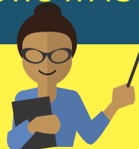
อาจารย์ที่ปรึกษา/หัวหน้าหลักสูตร