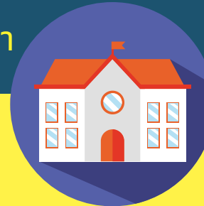
วิทยาลัยฯ