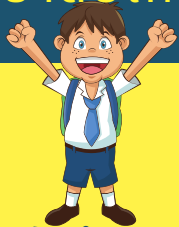
นักศึกษา