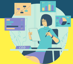
สถานประกอบการ

กรอกข้อมูลและยื่นคำร้อง https://collagermutl.tk