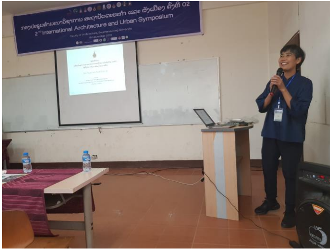
นำเสนอบทความวิชาการ