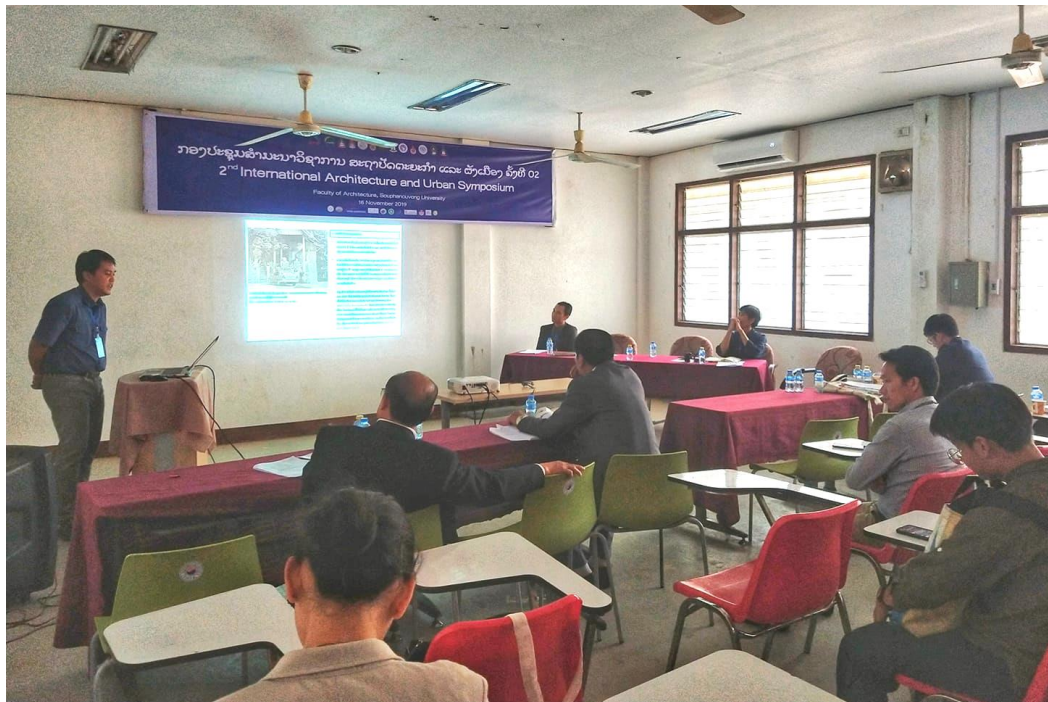
รับเชิญเป็น Moderator ใน Session 6