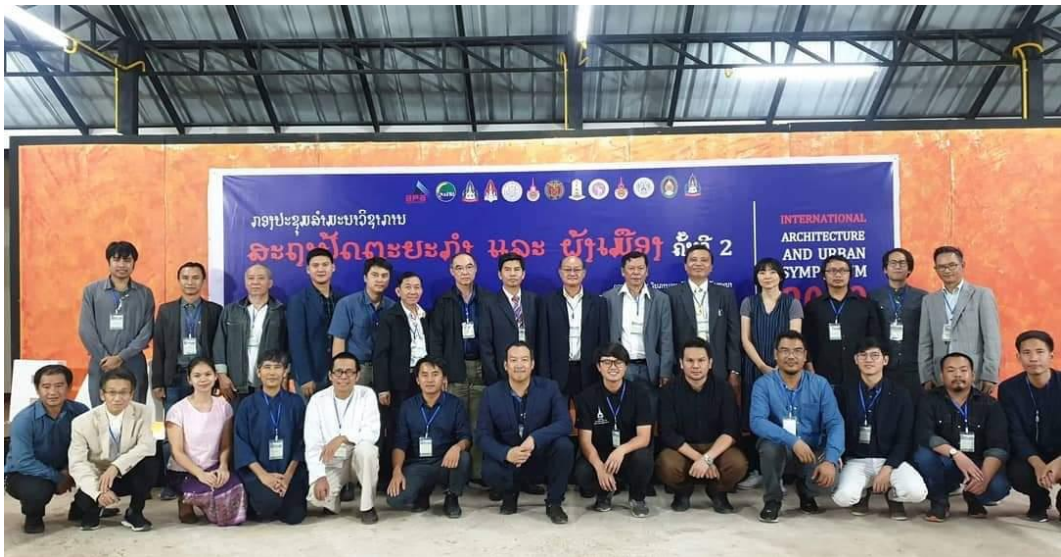
ผู้เข้าร่วมนำเสนอบทความ