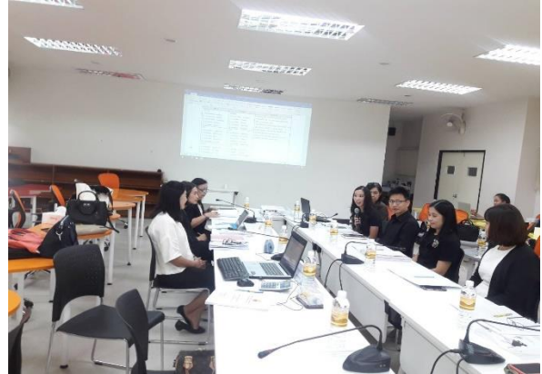
สัมภาษณ์อาจารย์ผู้รับผิดชอบหลักสูตร