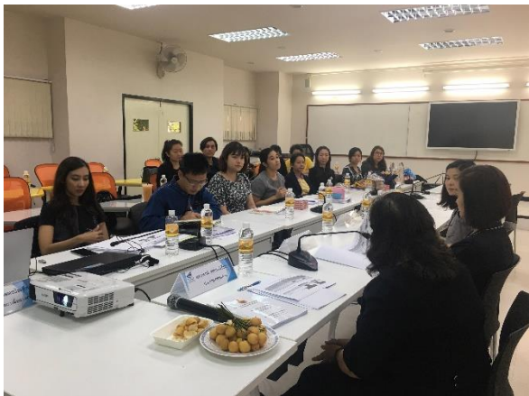
ศึกษาเอกสารหลักฐาน/ข้อมูลเพิ่มเติม