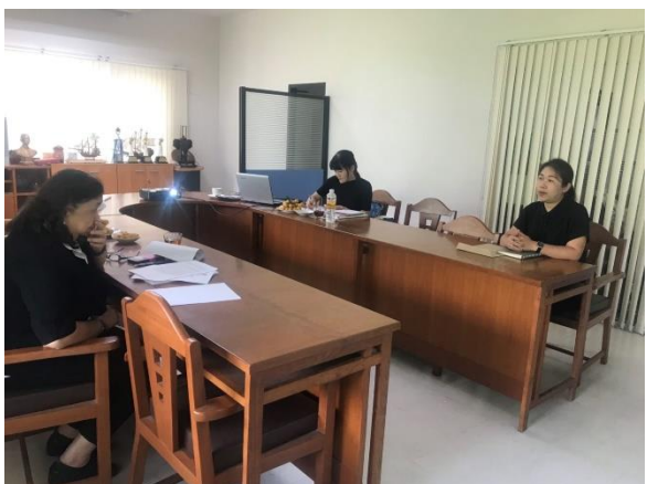
สัมภาษณ์ตัวแทนผู้ประกอบการ