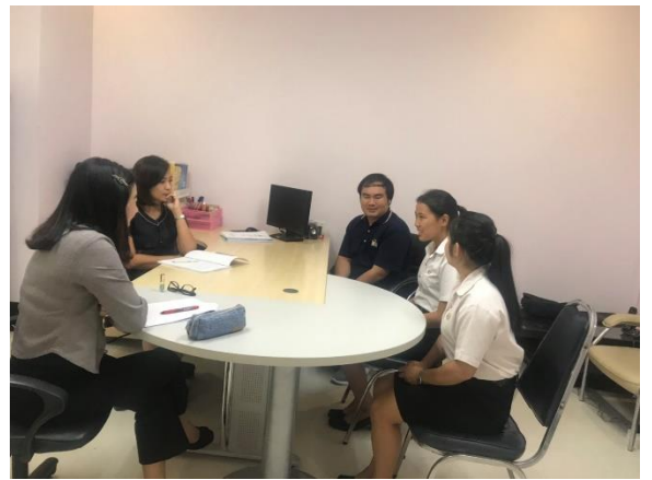
สัมภาษณ์ตัวแทนนักศึกษา/ตัวแทนศิษย์เก่า