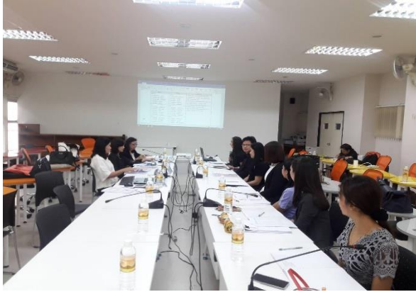
ประธานหลักสูตรนำเสนอผลการดำเนินงาน