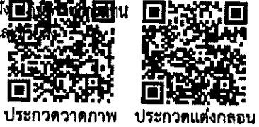
ประกวดวาดภาพ ประกวดแต่งกลอน

รองอธิบดีกรมทรัพยากรทางทะเลและชายฝั่ง อธิบดีกรมทรัพยากรทางทะเลและชายฝั่ง