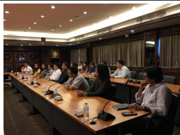
สัมภาษณ์อาจารย์