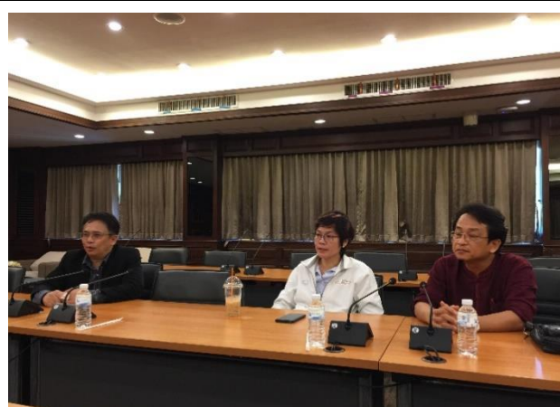
สัมภาษณ์คณบดี