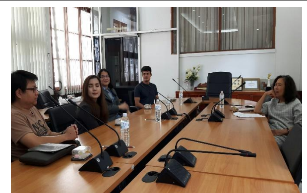
สัมภาษณ์ผู้ประกอบการ