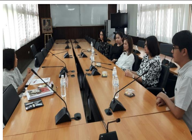
สัมภาษณ์บุคลากร