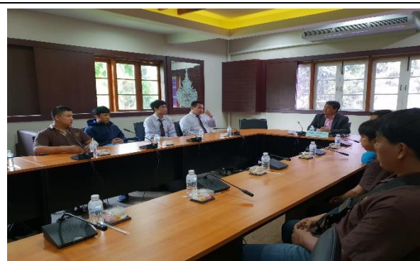
สัมภาษณ์นักศึกษาและศิษย์เก่า