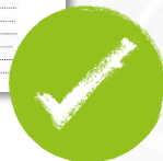
บัตรเข้าห้องสอบ