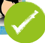
สำเนาบัตร ประชาชน 1 ชุด

หมายเหตุ ข้อมูลสถานที่จัดอบรมและทดสอบ ถูกระบุอยู่ในส่วนของรายละเอียดบนบัตรเข้าห้องสอบ