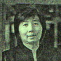
Siti Mina Tamah Widya Mandala Catholic University, Indonesia

For more details and registration, please visit www.culi.chula.ac.th/research