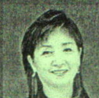
Reongrudee Maneepakhathorn Chulalongkorn University, Thailand